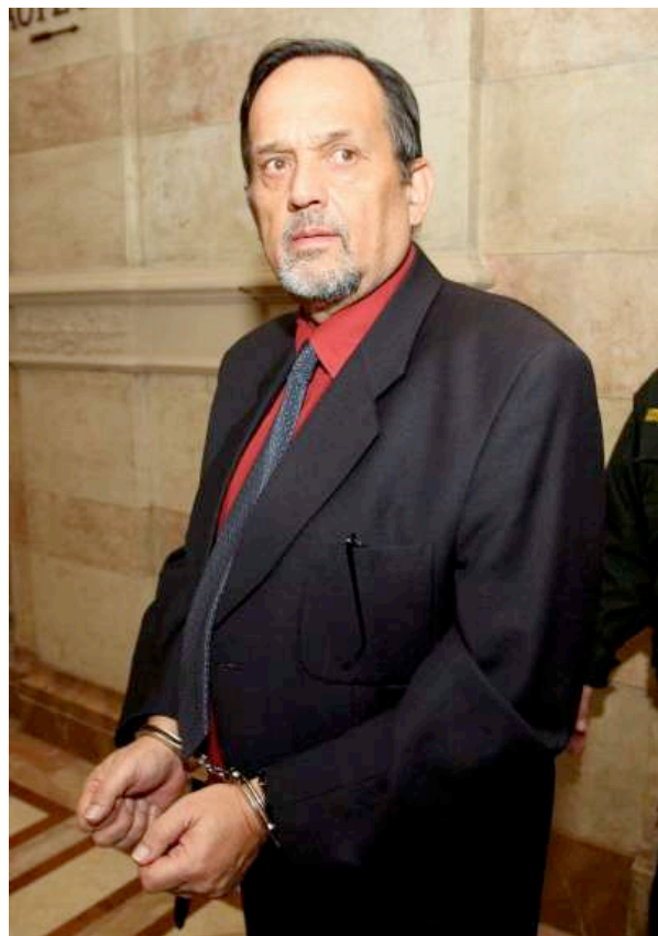
(EFE) El pronazi Gerd Honsik. EFE/Archivo

Viena.- El Tribunal de lo Penal de Viena condenó hoy a cinco años de prisión al negacionista austríaco del Holocausto Gerd Honsik, detenido en agosto de 2007 en la ciudad española de Málaga y extraditado a Austria.