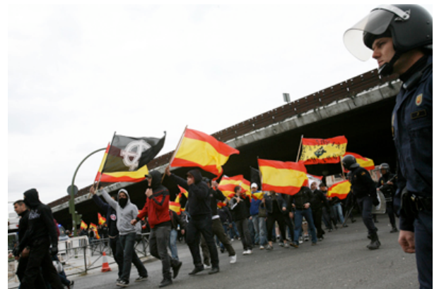
Un grupo de neonazis en el barrio de Vallecas (Madrid), durante una marcha fascista. - GABRIEL PECOT

"Hay grupos organizados que, hasta ahora, disfrutaban de cierta permisividad. E incluso algunos que, bajo apariencia de