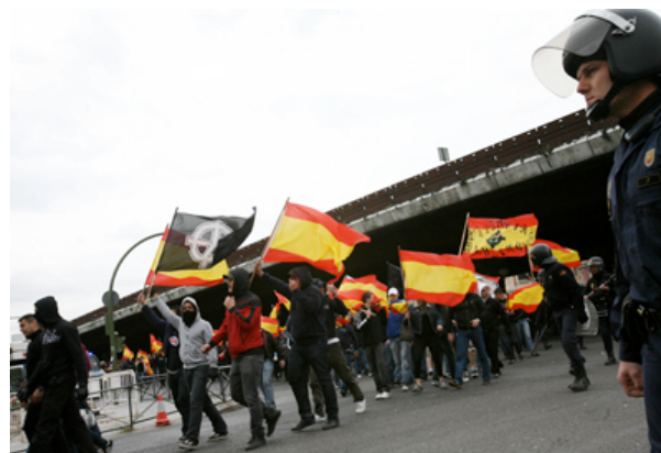
Un grupo de neonazis en el barrio de Vallecas (Madrid), durante una marcha fascista.

"Hay grupos organizados que, hasta ahora, disfrutaban de cierta permisividad. E incluso algunos que, bajo apariencia de