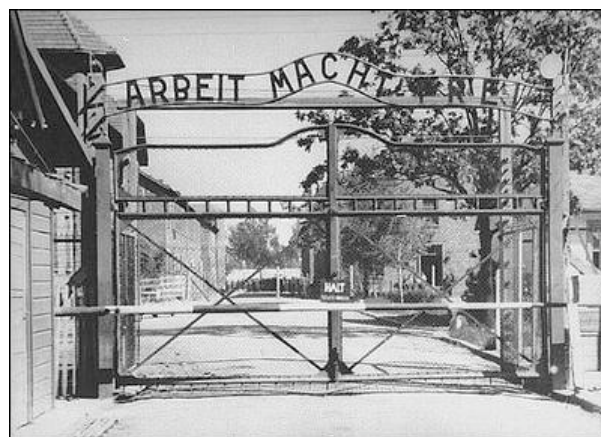
Campo nazi de Auschwitz-Birkenau.

Se calcula que los nazis asesinaron allí entre 1940 y 1945 a más de un millón de personas, el 90% de las cuales eran judíos y el resto gitanos, homosexuales, así como presos soviéticos y polacos.