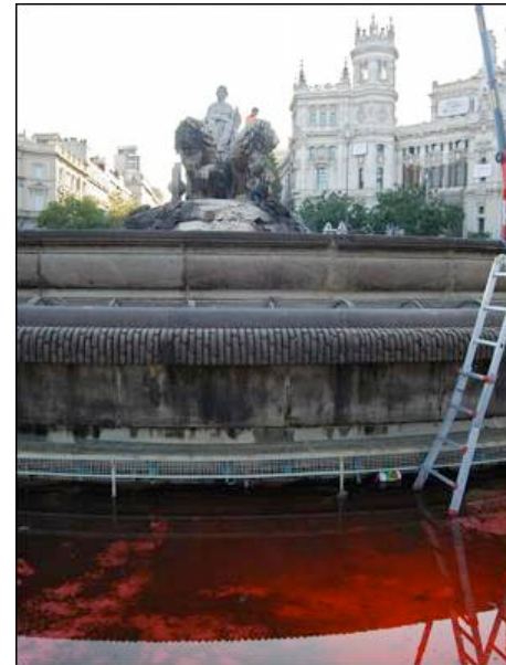
La fuente de Cibeles, teñida de rojo.

Los efectivos de mantenimiento de fuentes, que dependen de la Concejalía de Medio Ambiente, han procedido al vaciado de las piletas para poder limpiar los vasos y volverlos a llenar, aunque antes deberán analizar el tinte por si ha afectado a la piedra. Las tareas de limpieza han comenzado esta mañana y se espera que a lo largo del día puedan recuperar su aspecto normal, han indicado las fuentes.